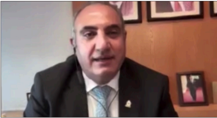
Yousef Shawarbeh , alcalde de Amman, Jordania

para la recuperación económica y la construcción de ciudades resilientes a través de empleos verdes; y empoderamiento de las pequeñas y medianas empresas.