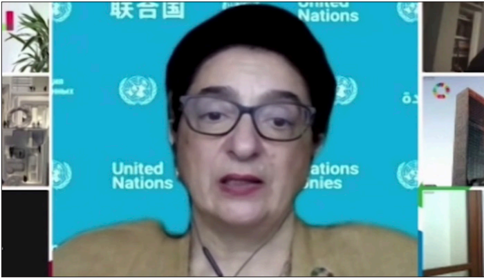
Maria-Francesca Spatolisano, ONU DESA

mencionó las redes de los ODS y la cooperación con 124 gobiernos locales para la localización de la implementación.