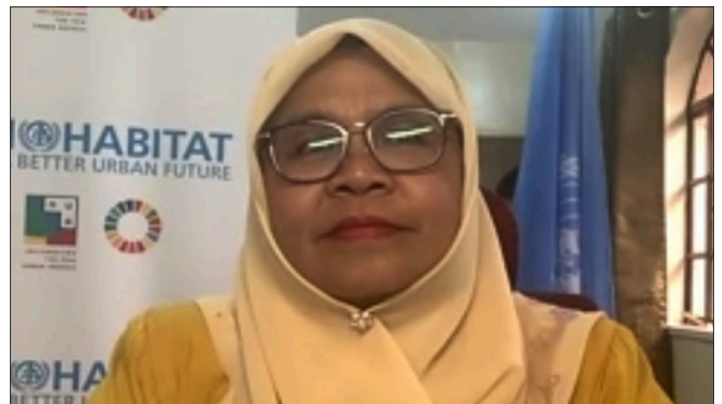
Maimunah Mohd Sharif, directora ejecutiva de ONU-Hábitat