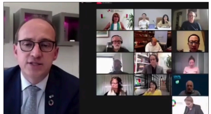
Wim Dries , alcalde de Genk, Bélgica