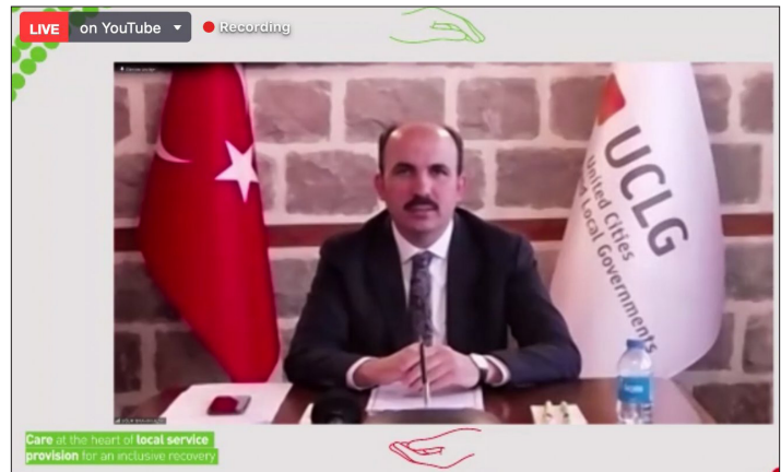
Uğur İbrahim Altay , Alcalde de Konya, Turquía, y Copresidente de CGLU

Uğur İbrahim Altay, Alcalde de Konya, Turquía, y copresidente de la CGLU, anunciaron que CGLU se ha unido a la plataforma de múltiples sectores de UHC2030, en un esfuerzo por fortalecer la relación entre los movimientos municipales y sanitarios y lograr cobertura sanitaria universal y sistemas de salud que protejan a todos. Tras señalar que el Diálogo se estaba