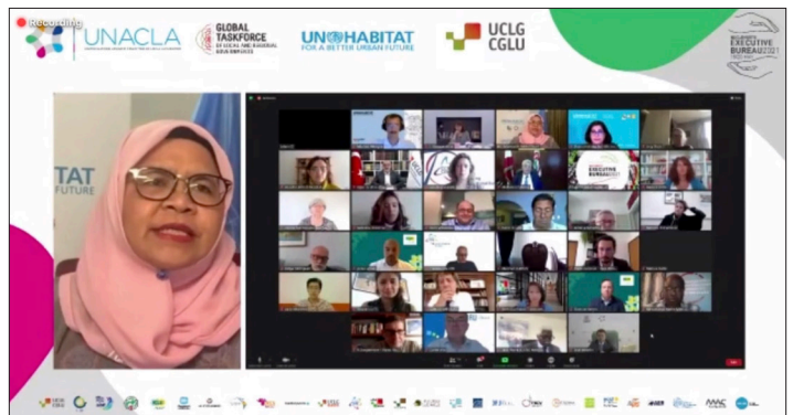
Maimunah Mohd Sharif, Directora Ejecutiva de Habitat ONU

Mohd Sharif dirigió la atención al impulso cada vez mayor que tienen las revisiones locales voluntarias. Dijo que varias de ellas serán presentadas en el Foro Urbano Mundial, que tendrá lugar en Katowice, Polonia, en junio de 2022. Explicó a los participantes que es probable que en 2022 el Foro Político de Alto Nivel sobre Desarrollo Sostenible (HLPF) revise el ODS 11 (ciudades y comunidades sostenibles), poniendo el desarrollo local en el centro del debate internacional. Mohd Sharif también destacó el trabajo en curso para desarrollar un marco global de monitoreo