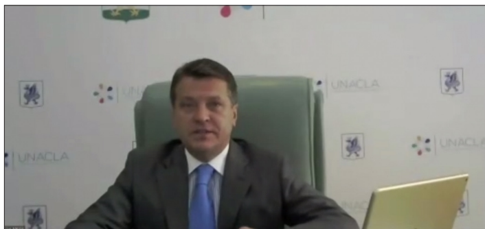
Ilsur Metshin , Alcalde de Kazan, Federación Rusa, y Copresidente de UNACLA, moderó la sesión.

urbano, destinado a apoyar a las ciudades en el seguimiento del progreso del desarrollo.