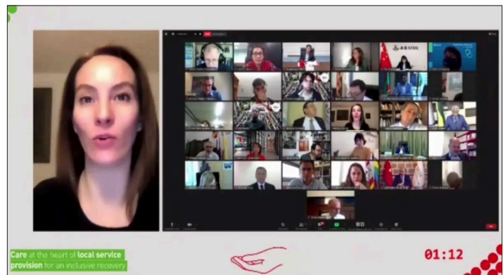
Gabriela Cuevas Barrón , Copresidente UHC2030

Gabriela Cuevas Barrón, Copresidenta de UHC2030, dio la bienvenida a CGLU al movimiento UHC2030. Ella destacó que la participación de líderes locales es imprescindible a hacer que los sistemas de salud sean universales. Cuevas Barrón subrayó que los sistemas centrados en las personas y los derechos son más adecuados para responder a los brotes de enfermedades. Hizo hincapié en la necesidad de aplicar una lente del género a todos los aspectos de este trabajo. Y, al pedir centrarse en la reducción de vulnerabilidades, sostuvo que la vulnerabilidad no debe definir a los individuos.